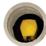
① Raccord rapide

Tous les regards ST sont munis d'orifices d'accès rapide pratiques. Les clapets vanne offrent des points d'eau pratiques pour rincer les écoulements et la peinture soluble à l'eau. Leur intégration dans le regard permet de se passer de regard supplémentaire.